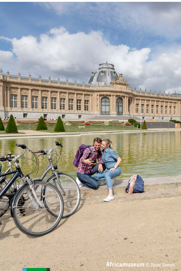
Africamuseum © David Samyn